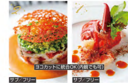
サブ/フリー サブ/フリー ヨコカットに統合OK(内観でも可)

1. キャプション各40文字 かな前菜をはじめ、野菜をたっぷり散りばめた一皿は、まさに一期一会 2. 材料を仕入れ、コースを仔羊の低温ローストとそのトマト煮込みタスマニア産の仔羊肉に